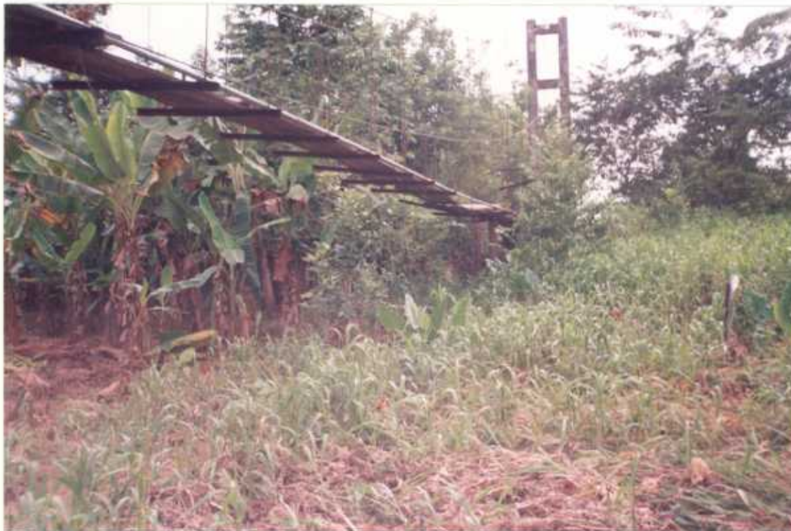
PUENTE PRINCIPAL Y PEATONAL SOBRE EL RIO BALZAR. CIUDAD CORTES