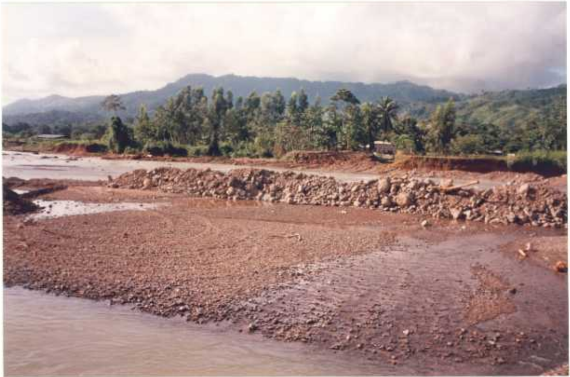
VADO POR EL RIO UVITA ENTRE LOS POBLADOS DE UVITA Y BAHIA. COORDENADAS 491.350/346.700