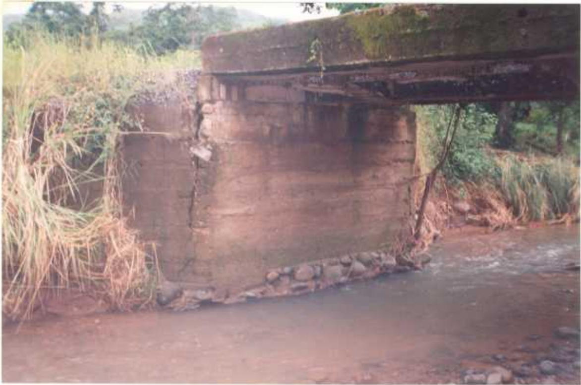
BASES FRACTURADAS DEL PUENTE SOBRE LA QUEBRADA ZAPOTE ENTRE PEJIBAYE Y EL AGUILA (COORDENADAS 511.300/344.700)