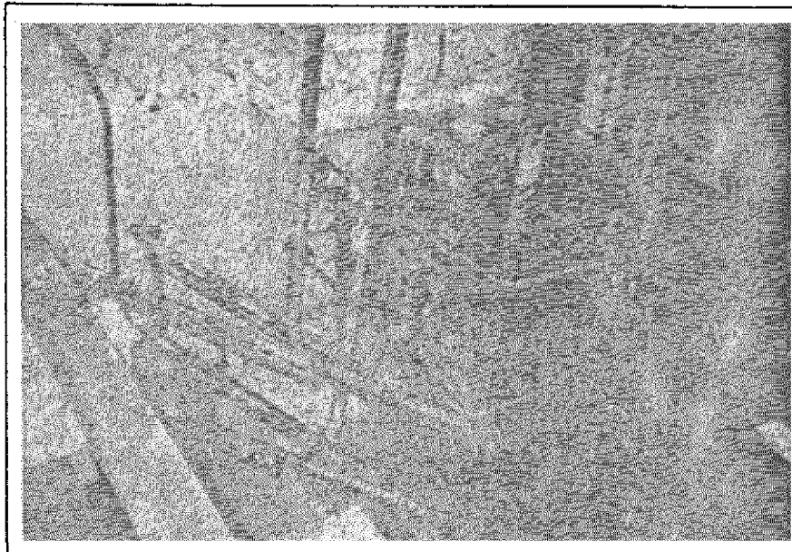
Nudo de unión de estructura existente y nueva

Durante la etapa de construcción surgieron algunas