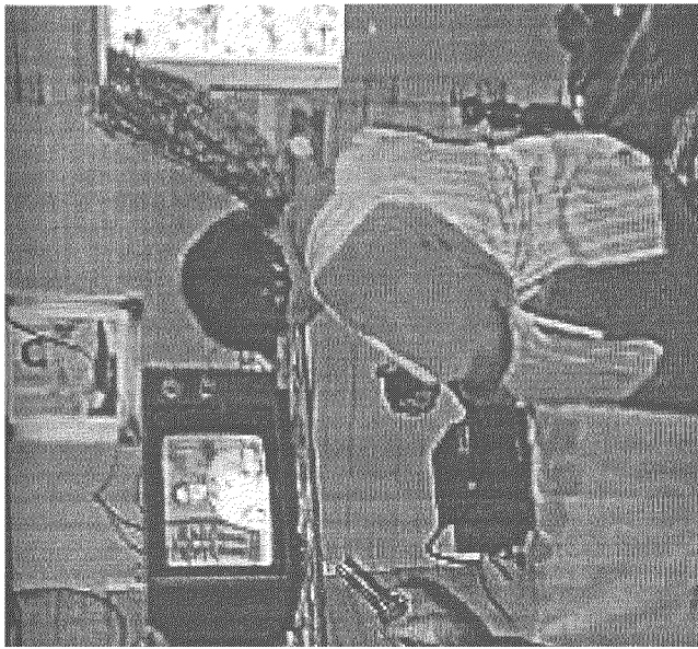
SITIO PIEDRA GRANDE