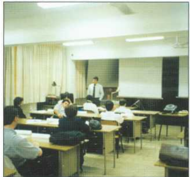
Funcionario de la C.N.E. impartiendo charla sobre seguridad hospitalaria a representantes latinoamericanos