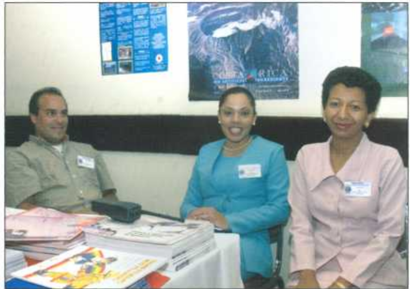
Información ofrecida al público nacional e internacional durante en el Seminario FAHUM 2001