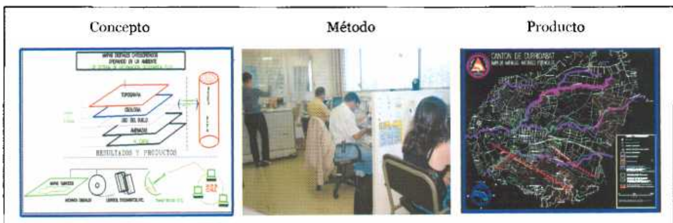
Sistema de Información para Emergencias (SIE).

Este período se caracterizó precisamente por crear la plataforma que sirve para aumentar las capacidades en el manejo de información en tres niveles nacional, regional y local, de ahí la importancia de contar con mapas digitales y analógicos con escalas legibles (escalas 1:50000).