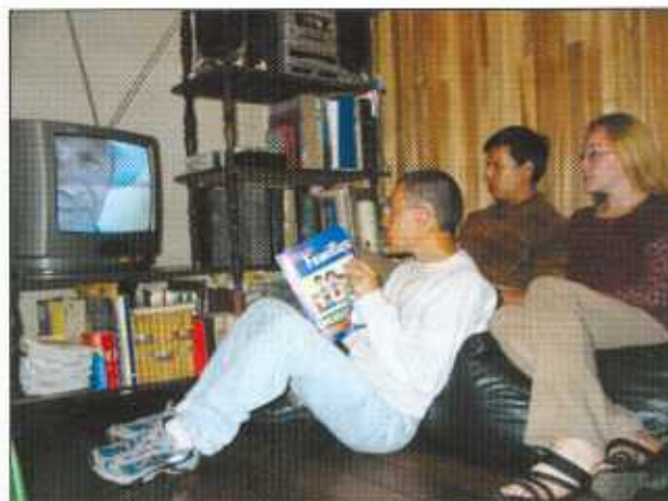
La información de las campañas en los medios de comunicación llegó a todos los hogares costarricenses

Por ello, en un esfuerzo interinstitucional 4 ,