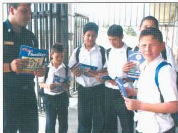
Distribución del Plan Familiar de Emergencias por medio de las Estaciones de Bomberos y Delegaciones Policiales.

se diseñaron y transmitieron dos campañas informativas. En el año 2000 se difundió una campaña en los canales de televisión y emisoras radio sobre desastres, con énfasis en la organización familiar ante inundaciones. En octubre del 2001 se lanzó la segunda campaña sobre medidas de prevención ante sismos. Para éstas, se contó con espacios financiados por los canales de televisión y emisoras de radio.