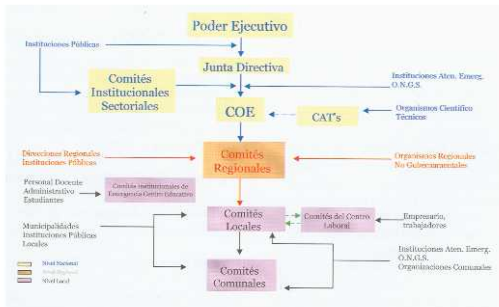
Figura No. 1 Organización Nacional para la Gestión del Riesgo y Atención de Emergencias

A partir de la publicación de la Ley Nacional de Emergencia (Octubre, 1999), se modifica el marco jurídico que posibilita a la C.N.E. trabajar en aspectos de prevención del riesgo. Por ello, se hace necesario reformular el Plan Nacional de Emergencias de 1993, y elaborar el "Plan Nacional de Prevención de Riesgos y Atención de