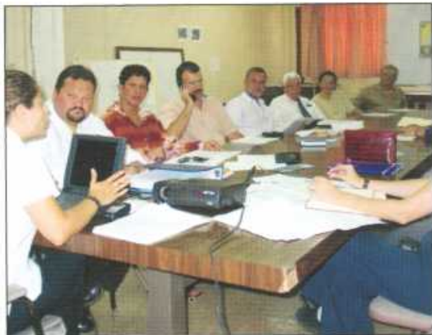
Reunión de coordinación de los Comités de Prevención y Atención de Emergencia de la Región Central

Su validación requieren la aprobación de la Junta Directiva.