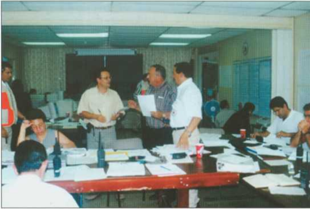
Sala de situación en la C.N.E. donde se reúne el C.O.E. para el manejo de la emergencia