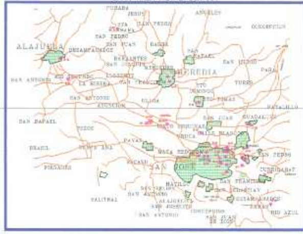
GRAN AREA METROPOLITANA