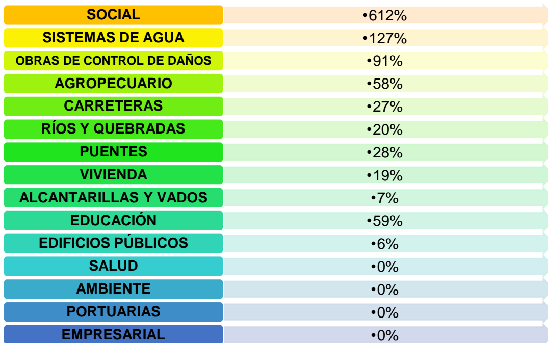
CUADRO 4 PORCENTAJE DE EJECUCIÓN FINANCIERA DEL PGE, SEGÚN ÁREA DE INTERVENCIÓN

Con la ejecución parcial o total de los planes de inversión gestionados, tanto con recursos propios de las instituciones como por medio del Fondo Nacional de Emergencias, a 5 años de este evento, se tiene los siguientes porcentajes de ejecución financiera, con respecto a lo propuesto en el Plan General de la Emergencia, según área de intervención: